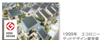
1999年 エコロニー グッドデザイン賞受賞