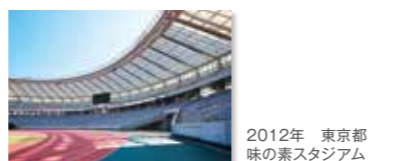
2012年 東京都 味の素スタジアム