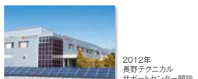
2012年 長野テクニカル サポートセンター開設