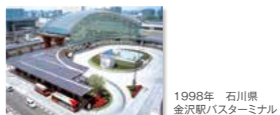
1998年 石川県 金沢駅バスターミナル